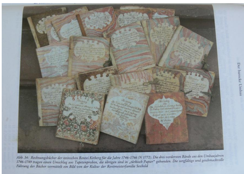
Abb. 34: Rechnungsbücher der steinischen Rentei Kirberg für die Jahre 1746–1766 (N 1772). Die drei vordersten Bände aus den Umbaujahren 1746–1749 tragen einen Umschlag aus Tapetenproben, die übrigen sind in „türkisch Papier“ gebunden. Die sorgfältige und geschmackvolle Führung der Bücher vermittelt ein Bild von der Kultur der Rentmeisterfamilie Seebold